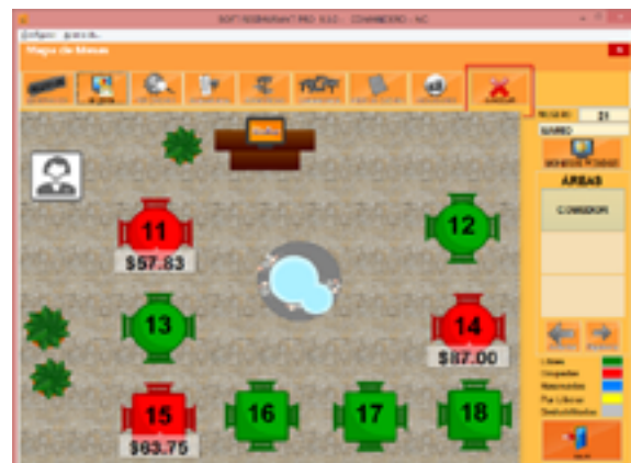
Mapa de Mesas con Indicadores