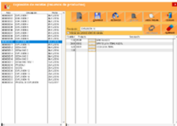
Explosión de Productos