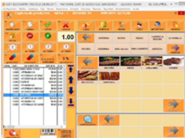
Captura de Productos