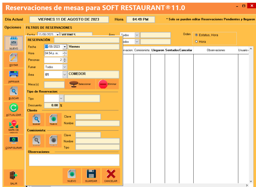
Pantalla de configuración